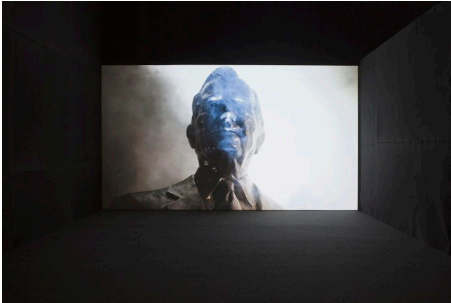
Vista de la proyección en la sala de Parque Galería.

jf huerta: ¿Qué función tiene el video en la exhibición?